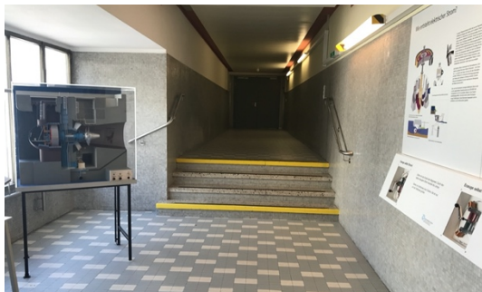
Eingang Maschinenhalle (2. UG)